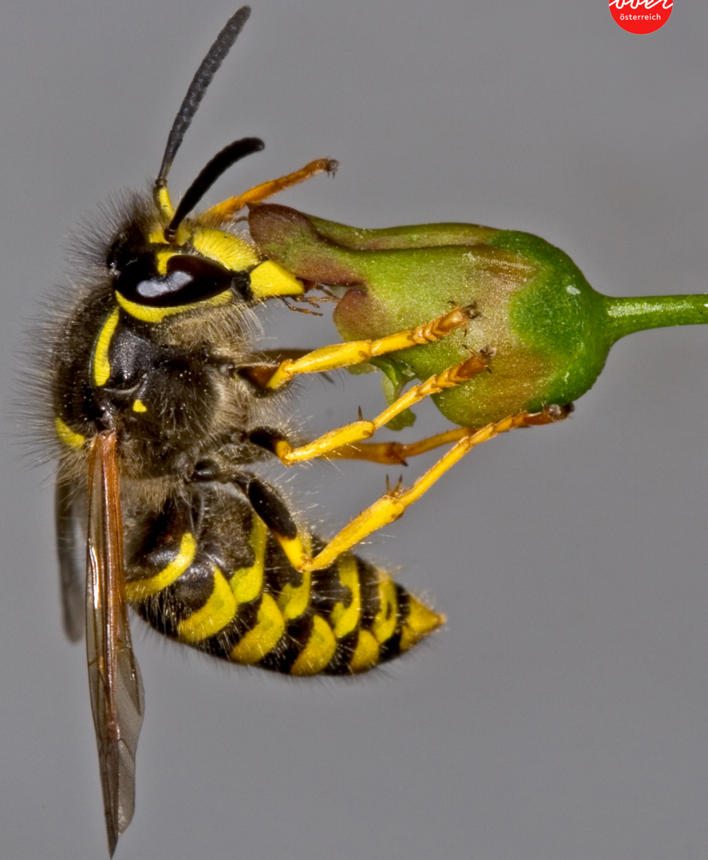
Dolichovespula sylvestris